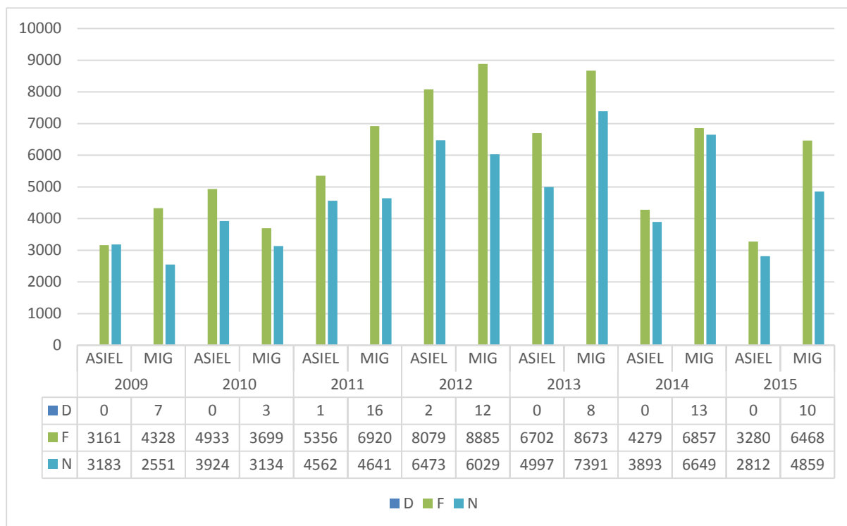
Fig. 3: algemeen overzicht van de input per type contentieux en per taalrol