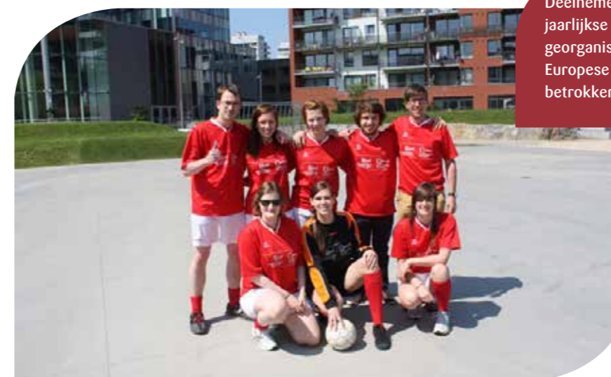
Deelnemers aan het jaarlijkse toernooi EUROFOOT georganiseerd tussen Europese organisaties betrokken bij asiel en migratie.

“De hoofdbekommernis van de Raad is rechtsbescherming bieden aan de vreemdelingen ten aanzien van beslissingen van de overheid. Hij baseert zich hiervoor op internationale, Europese en nationale regelgeving en rechtspraak.”